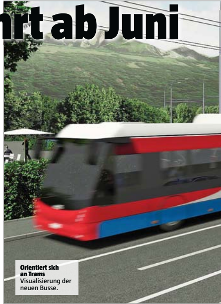
Orientiert sich an Trams Visualisierung der neuen Busse.

Geplant ist, die Linie 1 in den nächsten Jahren nach Ebikon zu verlängern. Zwischen Kriens und Emmenbrücke strebt der Verkehrsverbund mit dem 3er eine neue Verbindung an. Mittelfristig sollen auch auf den Linien 2, 8 und 12 Doppelgelenktrolleys eingesetzt werden. ●