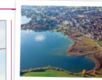
Verkehr soll abnehmen Die Gemeinde Cham.